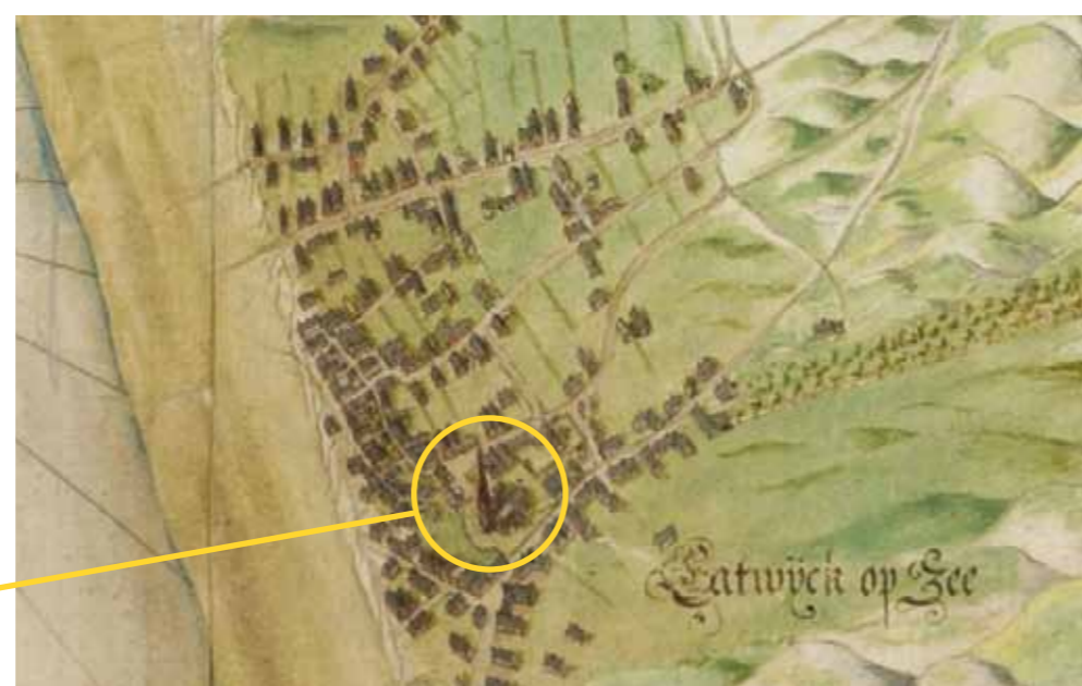
Ligging Witte Kerk in 1625 (Bilderbeeck)

In de 14e eeuw groeide het dorpje langzaam door de toename van de visserij. Mensen vonden ook werk in zeilmakerijen, visdrogerijen en kuiperijen. De dorpskern van Katwijk zag er heel anders uit dan nu. De Witte Kerk (of Oude Kerk) stond in het midden van het dorp. Een groot deel van de bebouwing ten westen van de kerk is door kusterosie verloren gegaan.