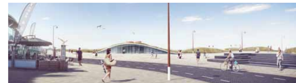
Eindruck des zentralen Strand Zugangs beim Zentrum