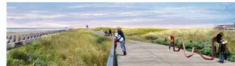
Eindruck der Dünenpromenade