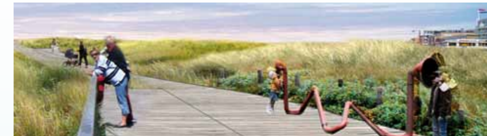
Impressie van de duinboardwalk