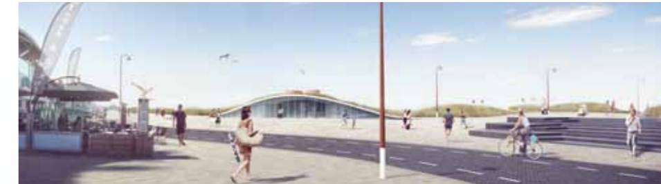
Impressie van de centrale strandafgang bij de Voorstraat